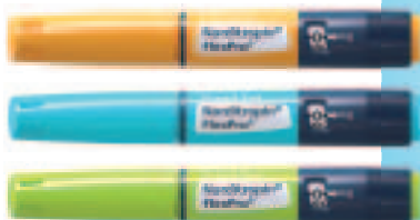
Norditropin® FlexPro® 5 mg/1,5 ml, 10 mg/1,5 ml und 15 mg/1,5 ml