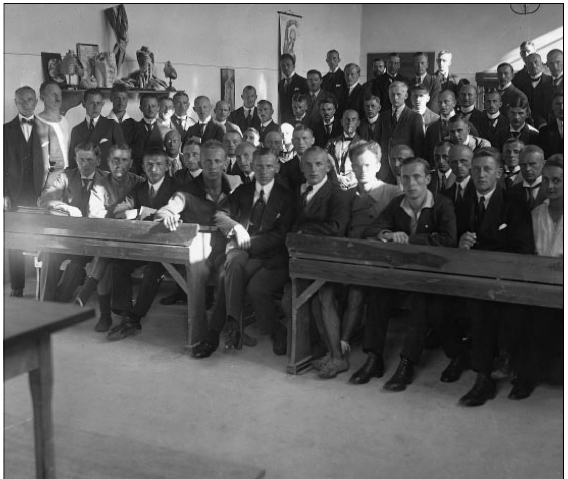
Gründungssemester der Deutschen Hochschule für Leibesübungen 1920/21

Auch die Sportorganisationen selbst verlangten jetzt - hartnäckiger als zuvor - wissenschaftliche Ratschläge und Ergebnisse. Offensichtlich hatten sie begriffen, daß sie angesichts der rapiden Sportentwicklung ihre Probleme auf Dauer nicht nur auf der Grundlage von Erfahrungen würden lösen können, wie das bis dahin geschehen war, sondern daß Sicherung und Steuerung ihrer Entwicklung auf wissenschaftliche Beratung angewiesen sei. Dies galt für den Bereich des Hochleistungssports ebenso wie für den Breitensport, für Prävention und Rehabilitation im Gesundheitsbereich wie für den Bereich der Schule. Hinzu kam die generelle Veränderung der Funktion der Wissenschaft in einer „verwissenschaftlichten“ Welt, in der