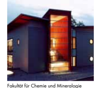
Fakultät für Chemie und Mineralogie