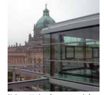
Blick vom Neubau Geisteswissenschaften auf das Bundesverwaltungsgericht